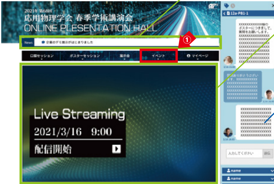
キャリア相談会スペース