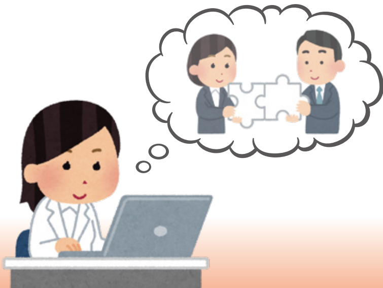
出展者ページ内のみ