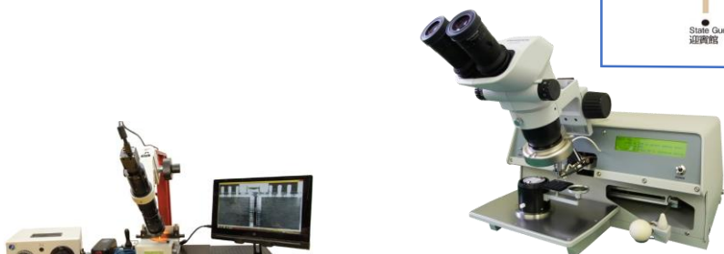
▲マニュアルワイヤーボンダー マニュアルダイボンダー