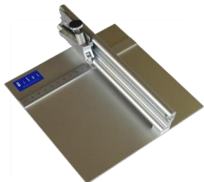
▲マニュアルスクライバー