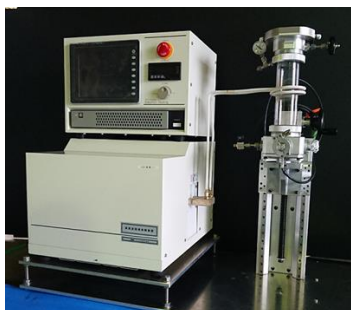
超高温表面反応装置