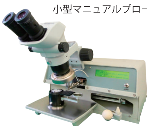
▲エポキシダイボンダー