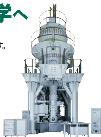
反応科学超高压電子顕微鏡【JEM-1000K RS】

▼まずは、 webサイト をごらんください。利用相談は随時受け付けています。(無料)